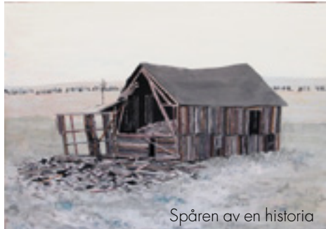
Spåren av en historia

Vi. Ett land utgörs av oss. Vi som bor här. Ofta förvandlas några av oss till Dom. Dom andra. Utställningen vill visa att bakom alla etiketter finns det en mängd olika öden, var och en med sin historia. Och tillsammans blir dom och du och jag just – vi.