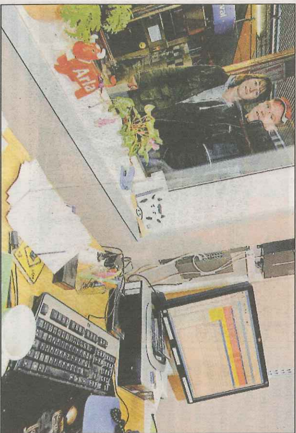
I arbetsrummet mitt i ladugården finns förstås en dator.

Övrabo lantbruk är ett familjeföretag i Ingatorps socken med inriktning på mjölkproduktion. Den kommersiella djurbesättningen består av 75 mjölkkor. Samt 100 ungdjur, kvigor och kalvar. Dessa återfinns i den nya, datoriserade lösdriftsanläggningen. På gården finns även två hästar samt två hundar.